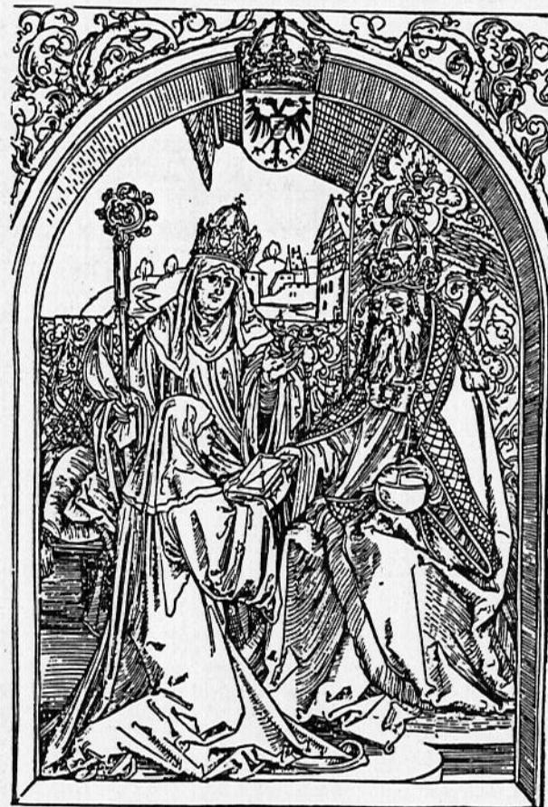
28 A. Dürer, A monja Rosvita apresenta um livro a Otão I. (Kupferstichkabinett, Berlim).